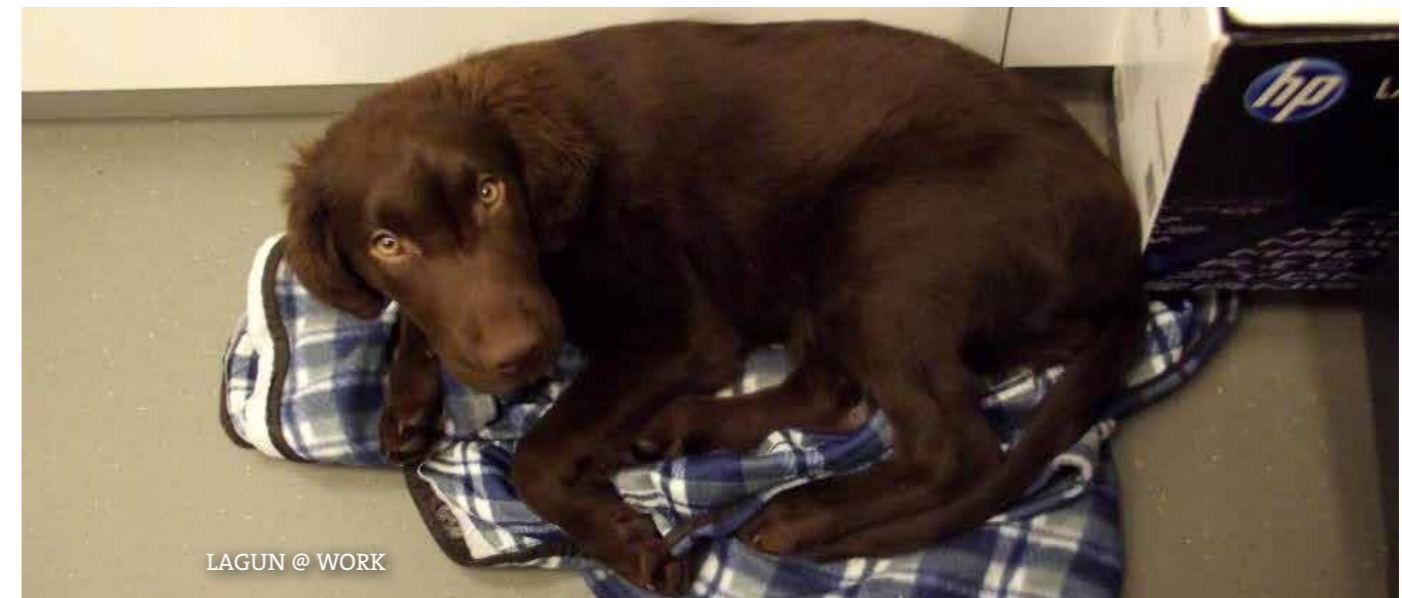
LAGUN @ WORK