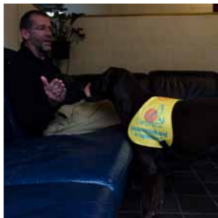
Baasje doet gebaar 'wat is er?'.