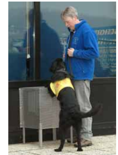
Eager die perfect de oefening 'up' uitvoert (eerste stap naar bvb betalen aan de kassa).

Nota van de redactie: Wie vragen heeft over assistentiehonden, kan altijd een mailtje sturen naar: redactie@woef.be Wij zorgen ervoor dat u een gedegen antwoord krijgt.