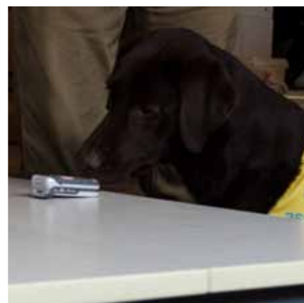
Hond loopt naar de bron van het geluid en baasje gaat mee, 'hier gsm'.